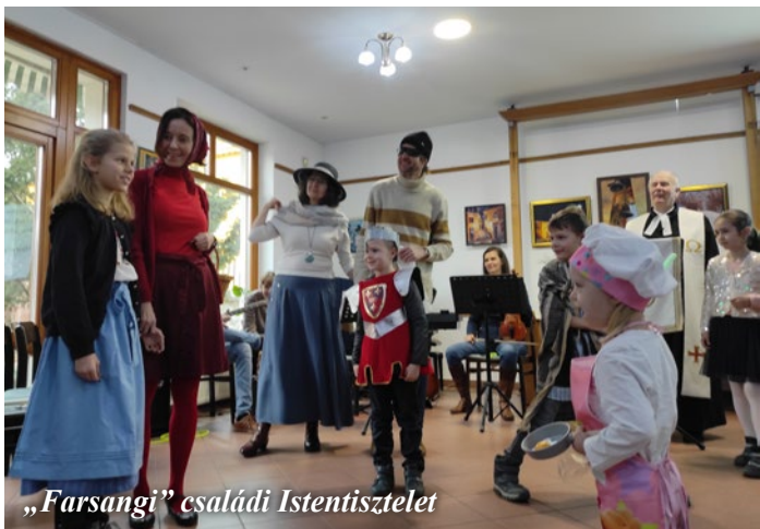
„Farsangi” családi Istentisztelet