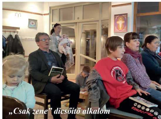
„Csak zene” dicsőítő alkalom