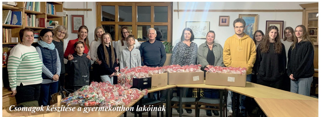
Csomagok készítése a gyermekotthon lakóinak