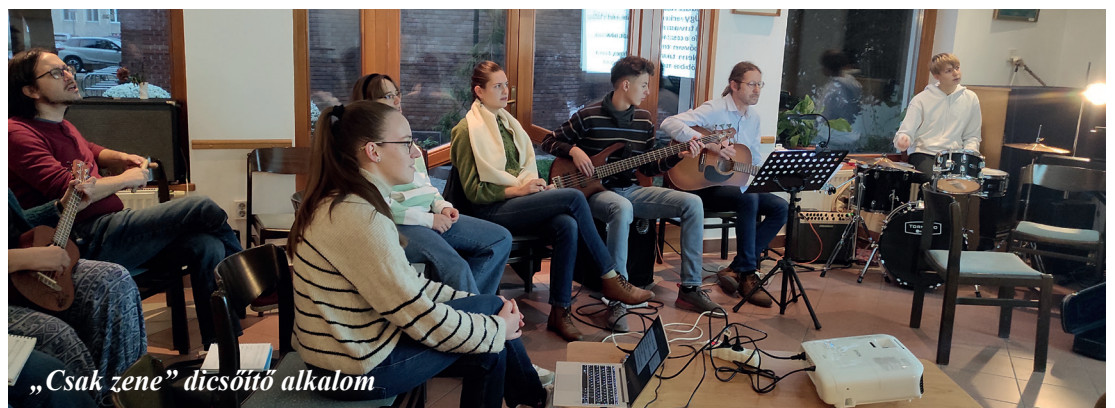
„Csak zene” dicsőítő alkalom