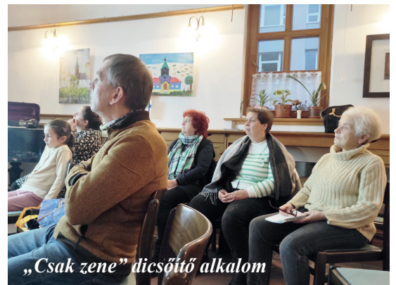
„Csak zene” dicsőítő alkalom