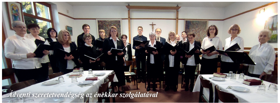
Ádventi szeretetvendégség az énekkar szolgálatával